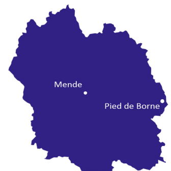
Département de la Lozère

Son environnement préservé, sa nature foisonnante et ses paysages naturels spectaculaires sont appréciés des touristes et des amateurs de randonnées, de pêche et d'activités en eaux vives.